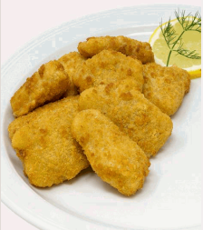
Fischnuggets Alaska-Seelachsstücke paniert und vorgebacken