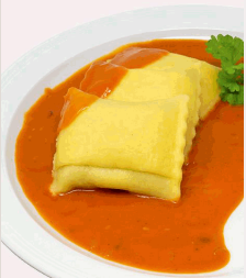
Geflügelmaultaschen in Tomatensoße