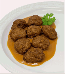
Köttbullar Rindfleischklößchen nach schwedischer Art in Preiselbeer-Rahmsoße