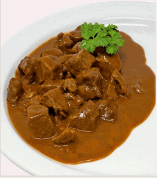
Herzhaftes Rindergulasch in Soße