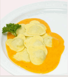
Teigtäschchen "Teddy" mit Spinat-Ricottafüllung in Karotten-Sahnesoße